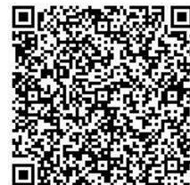
現況届出書 QR コード

新入団、再入団、住所の変更、勤務先等に変更があった場合の他 毎年1回の提出が必要になります。